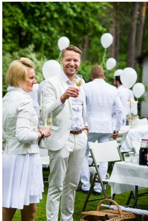
2014. gads 70 dalībnieki