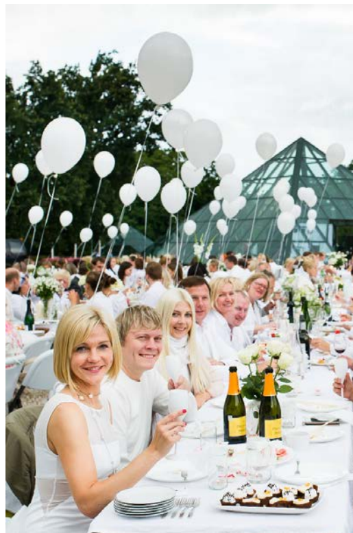
2015. gads 500 dalībnieki