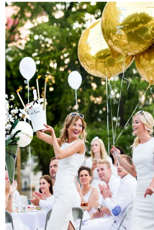
2016. gads 800 dalībnieki